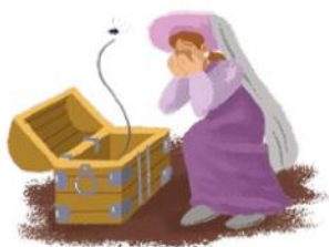
Enfraquecimento da nobreza feudal