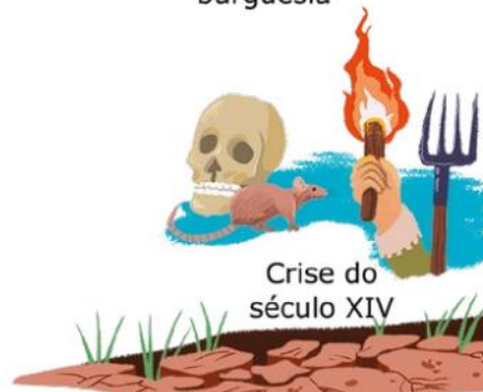
Crise do século XIV