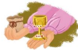
Formação da burguesia